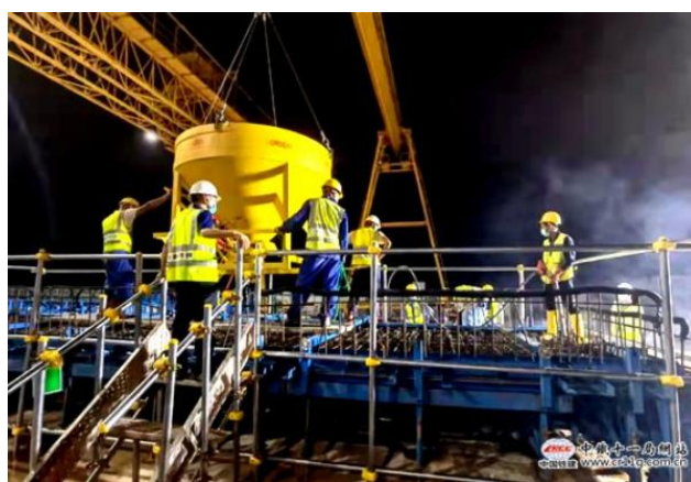
新加坡 J101 项目首片预制 T 梁成功浇筑