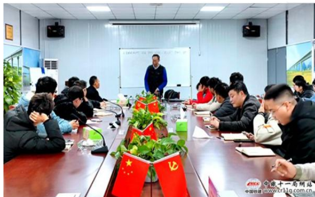
杭温项目邀请铁科院专家到梁场授课

预计到3月1日，荆荆项目将实现首梁架设目标。(文/刘清裕 图/慕有有余乐审稿/夏琴)