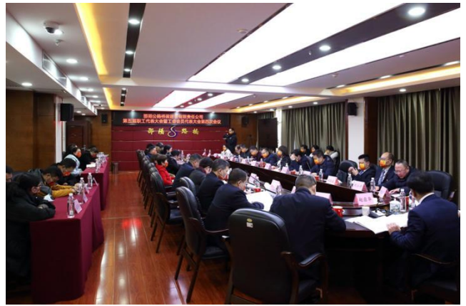
第五届职代会暨工代会第四次会议现场

当天下午，邵阳路桥第五届职代会暨工代会第四次会议顺利召开，与会代表认真履行好代表职责对公司年度工作报告、工会工作报告、财务工作报告等进行了讨论审议。