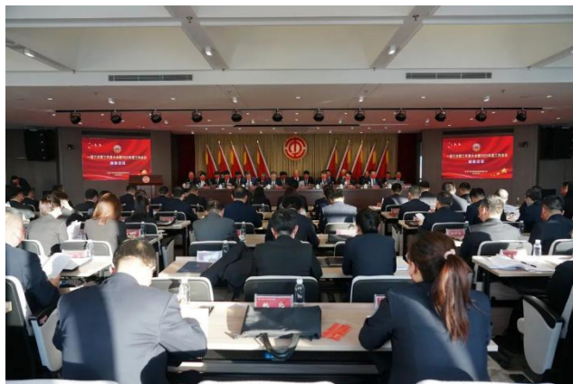
图 | 会议现场

2月28日，交投集团召开一届三次职工代表大会暨2022年度工作会议，来自集团总部和权属企业的职工代表肩负嘱托、履职尽责，共同为集团高质量发展建言献策。