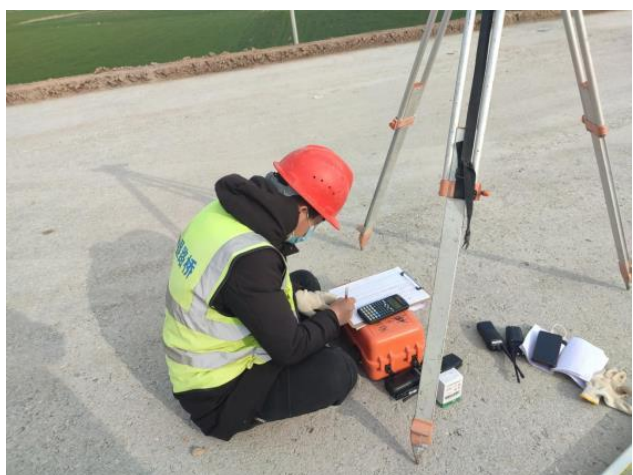
水稳放线、计算数据