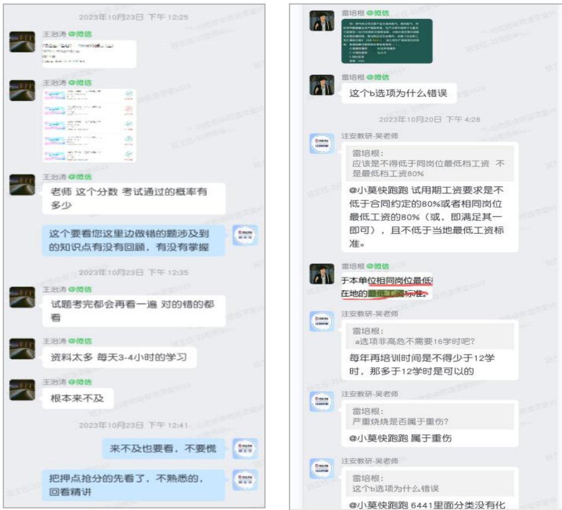
学员私享学习微信群及答疑展示

全过程监督学员学习进度，共累计为该企业学员提供督学服务 1.2 万多次。同时在“三人行”小群服务的模式下，针对每位学员的知识点疑问，教研老师都在第一时间应答，对每次的知识点问题都仔细研究，力图在解决问题的同时发现学员学习中的薄弱环节，给出针对性的学习建议。